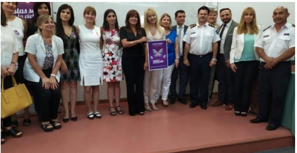
(Presentación del "Protocolo de actuación en casos de violencia" en Filosofía y Letras)

"Para revisar las concepciones binarias que muchas veces tenemos en nuestras universidades, la Ley Micaela es muy habilitadora, y las universidades adhirieron a su aplicación a partir de una iniciativa de la Red Universitaria de Género en el Consejo Interuniversitario Nacional (CIN). Una parte del sistema de gestión pública tiene una capacitación obligatoria a partir de la Ley Micaela que es muy importante" , añadió.