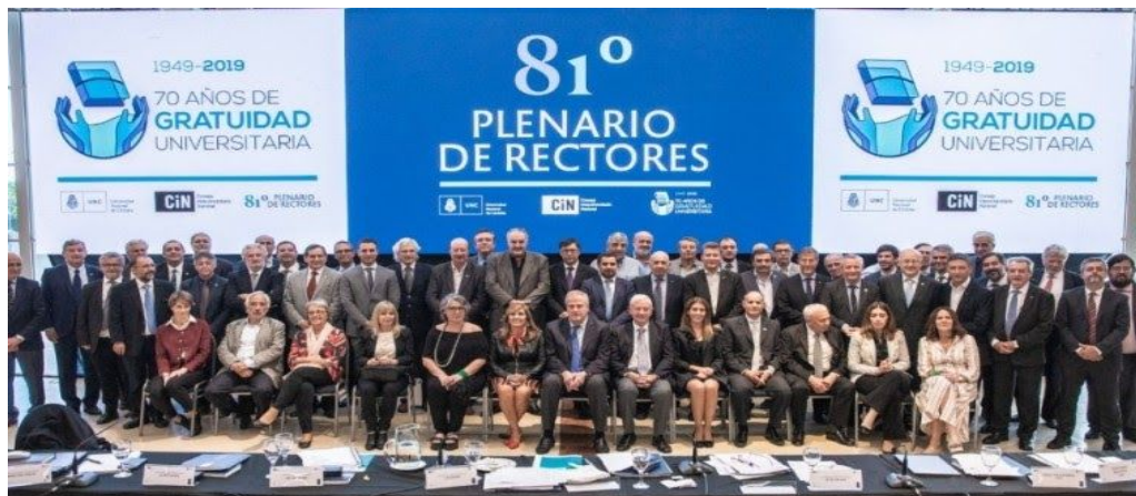
( 81 Plenario de Rectores del Consejo Interuniversitario Nacional en febrero de 2019)

"Evidentemente todavía hay una especie de sesgo, de arquetipo, en la conducción de las universidades que hace que ser rector o rectora se asemeje más a ser gerente de una empresa o el gobernador de una provincia o si se quiere al dirigente de la conducción de los sindicatos más resistentes al cambio. En este punto las universidades, que se autoperciben como fuertemente democráticas, no dejan de ser similares a otros espacios de organización en donde el poder está sumamente concentrado, es piramidal y se vincula primordialmente con conseguir recursos. Tiene que ver con un arquetipo del modelo de conducción que viene concentrado desde el capitalismo patriarcal", concluyó la exdecana de Filosofía y Letras (UBA).