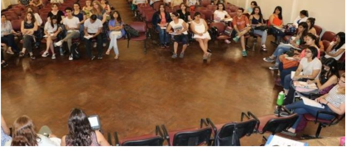
(Ciclo de Formación "Género, diversidad y violencias" en Filo con docentes de todo el país)

sumamente importante pero sabemos bien que los cambios normativos no son suficientes para garantizar la paridad real entre varones y mujeres, tal como vemos que pasa en el Congreso Nacional cuando una banca debe ser reemplazada”, analizó Sotelo.